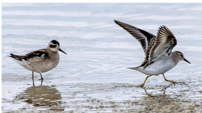
Gleich zwei Raritäten waren im September zu Besuch: Odinshühnchen (links) und Temminckstrandläufer.

Im August 2023 besuchten gleich zwei äusserst spezielle «Kurzaufenthalter» das Neeracherried. In der ersten Augustwoche rastete eine Zwergscharbe während fünf Tagen am Flachteich und wenige Wochen später liess sich ein Odinshühnchen – ein Brutvogel aus dem hohen Norden – kurz im Neeracherried nieder. Beide Arten waren noch nie zuvor im Gebiet nachgewiesen worden.