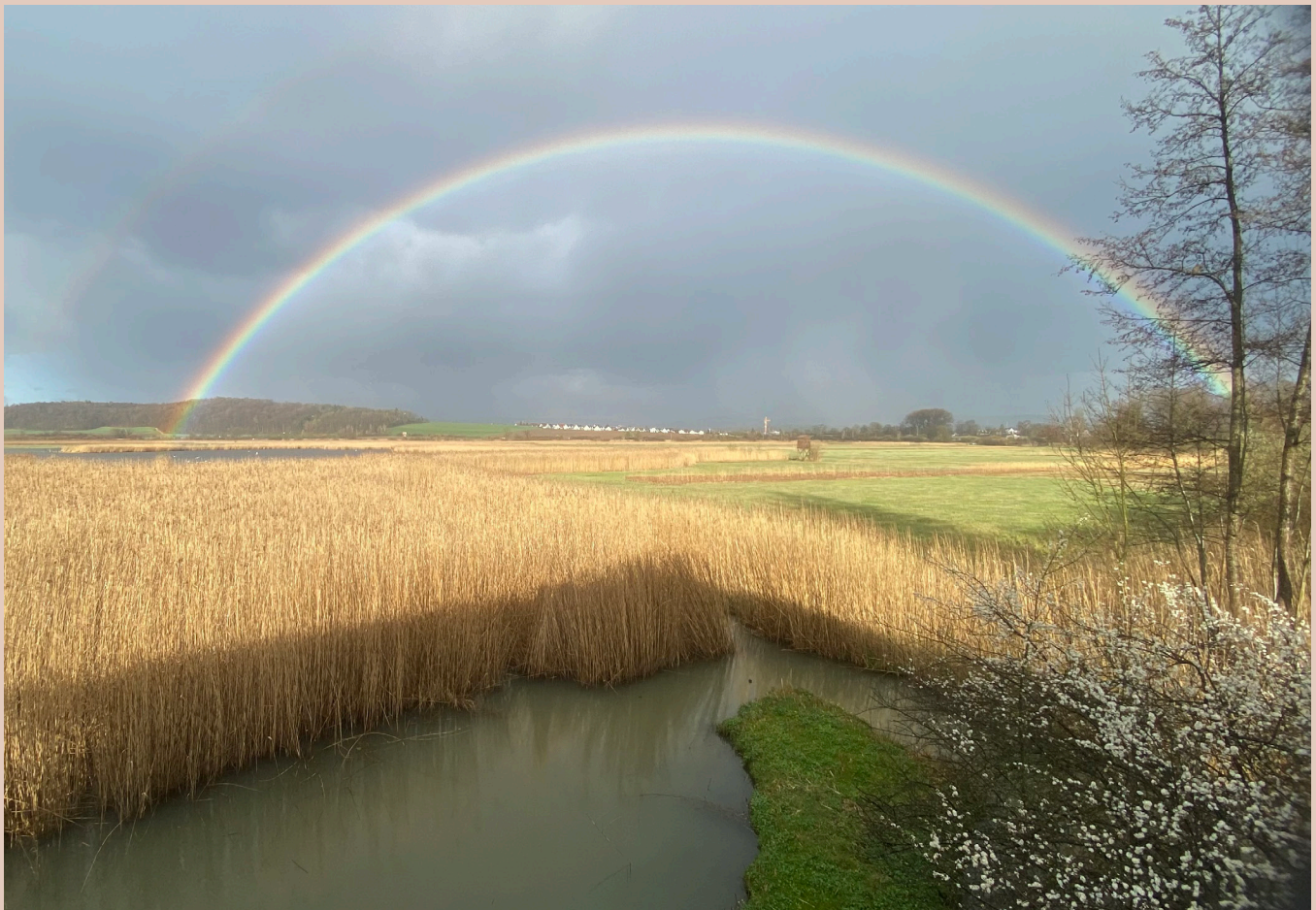
Immer wieder gibt es im Neeracherried fantastische Wetterstimmungen (Aufnahme vom 25. März).

Grosses Unglück in der Lachmöwenkolonie: Wegen der hoch ansteckenden Vogelgrippe starb ein Grossteil der Altvögel, nur zehn Jungvögel wurden flügge. Der Bruterfolg beim Kiebitz war hingegen erfreulich, ebenso freut uns die erste Brut der Kolbenente. Die renaturierten Saumbachwiesen entwickeln sich positiv: Neu blüht dort der Lungenenzian, und es konnten viele Watvögel beobachtet werden, darunter Seltenheiten wie Odinshühchen oder Temminckstrandläufer.