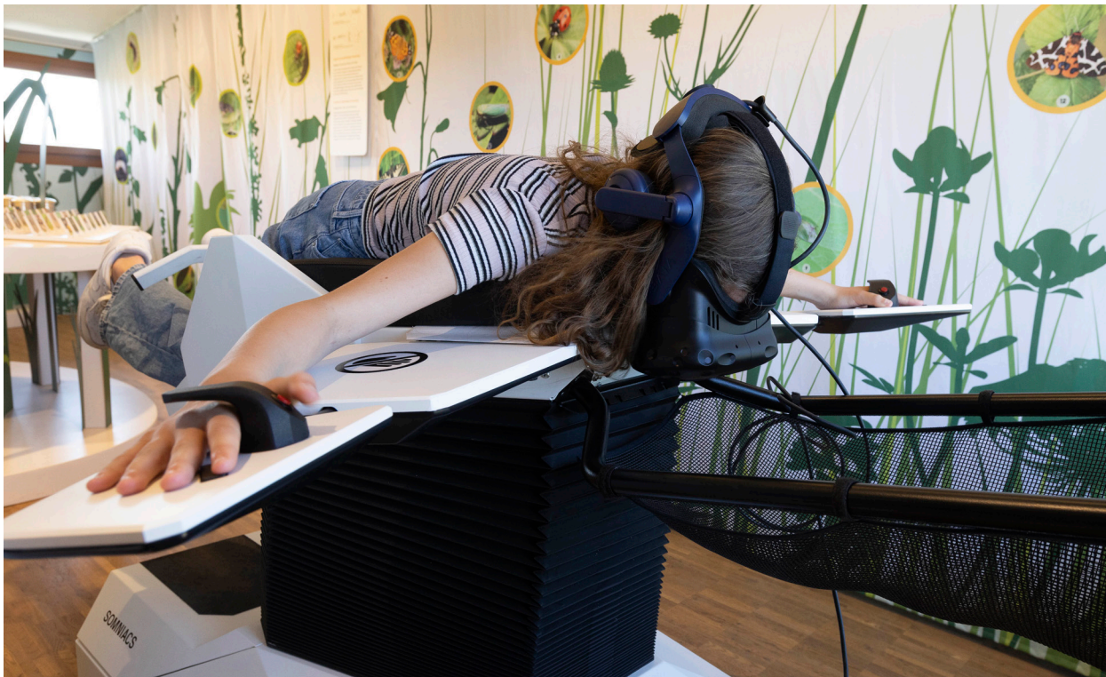
Auch im zweiten Jahr der Sonderausstellung die grosse Attraktion: der Insektenflugsimulator «Birdly Insects».