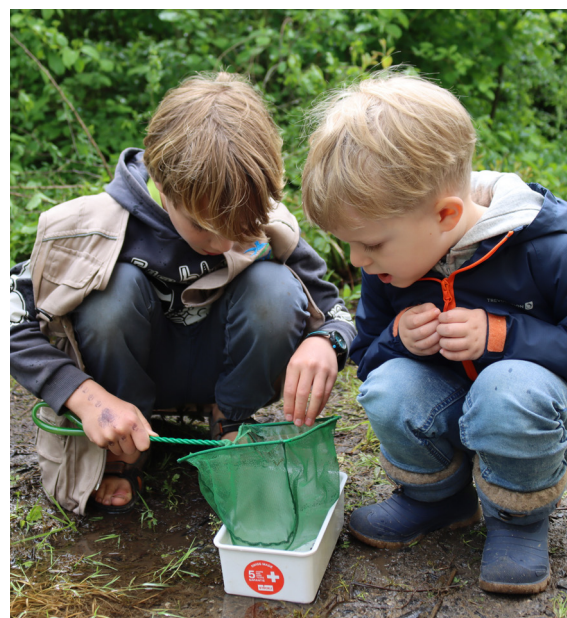
Teichinsekten keschern am Frühlingsfest.

An mehreren der öffentlichen Führungen waren die Insekten und ihre Förderung ebenfalls Thema, zum Beispiel an einem Teich-Workshop mit Familien oder an einer Wildbienen-Führung mit Erwachsenen.