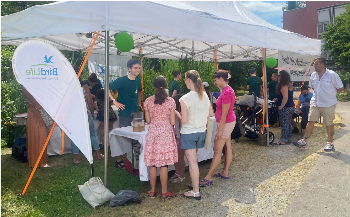
Dorffest Niederglatt: viel Betrieb am Naturzentrums-Stand.